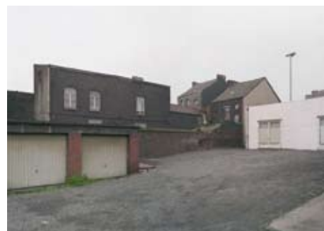
peripher 489 [Charleroi]

2006, C-Print/Acrylglas, 206 x 160 cm, 6+1AP