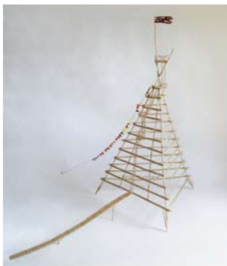
Shanty Tower 2006, Zahnstocher geleimt, 86 x 100 x 130 cm