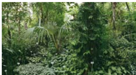
peripher 5 [Berlin]

2004, C-Print/Acrylglas, 158 x 92 cm, 6+1AP