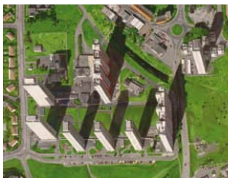
peripher A [Red Road, Glasgow]

2004, C-Print/Acrylglas, 158 x 92 cm, 6+1AP