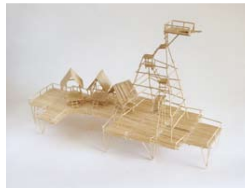
Pfahlbauerplattform 2006, Zahnstocher geleimt, 49 x 21 x 31 cm

2007, Zahnstocher geleimt, 28 x 26 x 19 cm