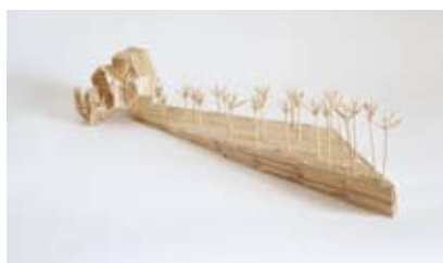
Das Feld von hinten aufrollen 2007, Zahnstocher geleimt, 48 x 19 x 11 cm